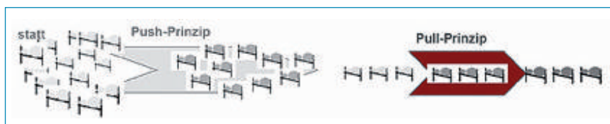
Abb. 2 Vom Push- zum Pull-Prinzip für geregeltere Abläufe auf Station.

Ein zentrales Ziel des Stationskonzeptes in Gütersloh war das Schaffen von mehr Ruhe auf Station durch gezieltes Management des Aufnahme-, Entlass- und Verweildauerprozesses. Hierfür wurden differenzierte Aufnahmeprozesse für Notfälle, elektive Patienten, Chemotherapie-Patienten sowie Verlegungen von Intensivstation ausgearbeitet. Die Einbestellung elektiver Patienten erfolgt nun gestaffelt zwischen 9 und 10 Uhr. Zudem wird spätestens 72 Stunden nach der Aufnahme das Entlassdatum geplant. Die Entlassplanung aus der Visite wird laufend in die EDV-gestützte Entlassliste übertragen und am Vortrag der Entlassung in die Stationsgrafik eingetragen. Ziel ist es, dass 2/3 aller Entlassungen bis 10 Uhr stattfinden. Dies wird auch im Gespräch und mittels eines Aushangs in den Patientenzimmern kommuniziert. So soll sichergestellt werden, dass Aufnahme- und Entlassprozess aufeinander abgestimmt ablaufen. Durch das effektive Verweildauermanagement und der neu geschaffenen Transparenz über die geplanten Entlassungsziele für alle Berufsgruppen soll die frühzeitige Freigabe des Patientenbettes am Entlassungstag und die geplante Aufnahme neuer Patienten sichergestellt werden.