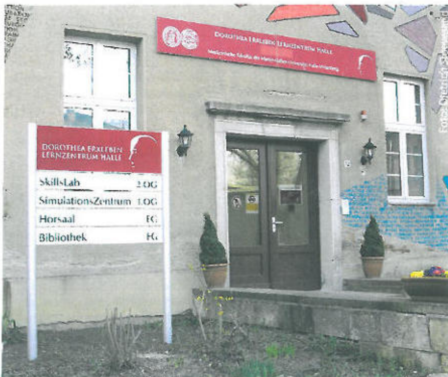
Abb. 2 Dorothea-Erleben-Lernzentrum Halle